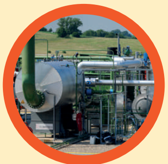
Centrale géothermique d'Hellisheidi, Islande.

L'énergie géothermique représente une alternative pour le futur. Plus on fore profondément dans la croûte terrestre, plus la température augmente... Cap sur l'Islande et l'Alsace, où l'on expérimente des techniques de pointe.